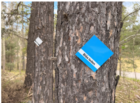
Två terrängleder märks upp på redan upptrampade stigar i skogen.

Älvsjöskogen har höga upplevelsevärden och används flitigt för promenader, löpning och annan motion samt förskoleutflykter och skolaktiviteter och är därför ett viktigt område för vardagsrekreation. Skogen har en stark vildmarkskänsla och naturskogskaraktär som bäst upplevs utanför motionsspåret. För att tillgängliggöra skogen för invånare har förvaltningen beslutat att anlägga två terrängleder som sträcker sig genom Älvsjöskogen.